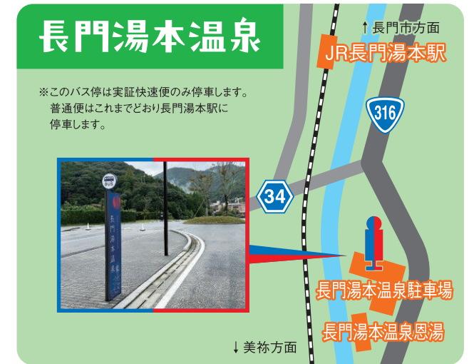
※このバス停は実証快速便のみ停車します。普通便はこれまでどおり長門湯本駅に停車します。