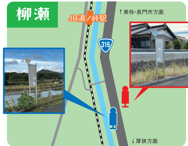
※湯ノ峠駅まで直線距離で約1.2kmの国道316号線沿いにあります。